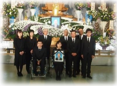
村田株式会社 全員揃って。