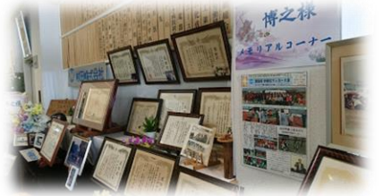
メモリアルコーナー