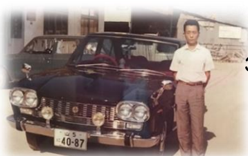
1967年7月 愛車と2ショット