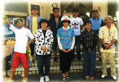
8月スタイリッシュDAY