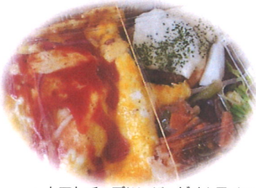
〜トマトチーズハンバーグオムライス〜

種類も5〜8種類から選べ、チキン南蛮弁当やハンバーグ弁当、豚の生姜焼き弁当などなど1日によって内容は変わります。 うまい・安い・おかずも豊富。 全部制覇したくなりました...。 食したお弁当を一部紹介します。(は)