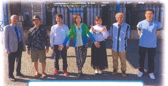
5月スタイリッシュDAY