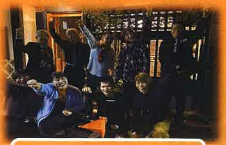
10月スタイリッシュDAY