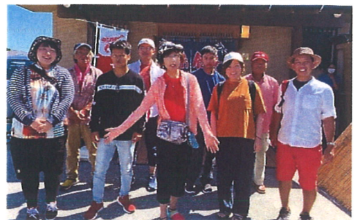
8月スタイリッシュDAY